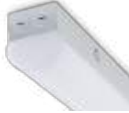
71182 | 70695