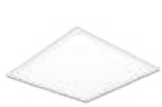
71163 | 70693