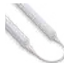
Cable de conexión 7" - 70404 12" - 70403