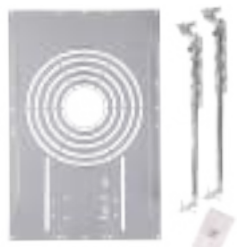
Bandeja de instalación para nueva construcción o reacondicionamiento 71176