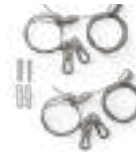
Kit de Suspensión para 70694 & 70696 71133