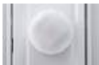
Sensor de movimiento de microondas de instalación inmediata