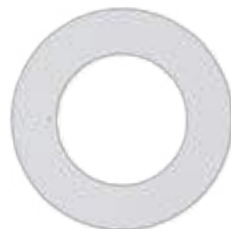
Anillo de protección para 6" Luz descendente 71174