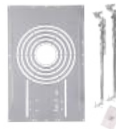
Bandeja de instalación para nueva construcción o reacondicionamiento 71176