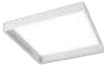
Kit de montaje en superficie de 2' x 2' 99271