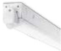
99305 | 99585