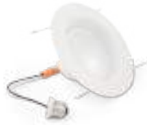
71143 | 71181