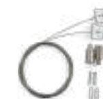
Kit de suspensión 70688