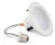
71142 | 71180

Las lámparas LED residenciales de Verbatim son una solución de alta eficiencia, en una sola pieza, para contratistas y propietarios. Estas atractivas lámparas LED retrofit de una sola pieza, ideales para entornos comerciales y residenciales, son aptas para la mayoría de las cajas de embutir estándar y son fáciles de instalar.