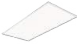
71155 | 71156 | 70694