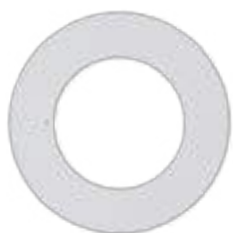
Anillo de protección para 6" Luz descendente 71174