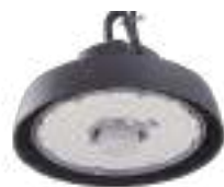
70605 | 71169