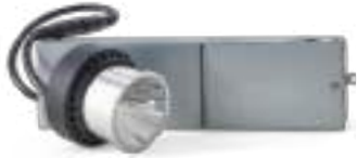
70651 | 70652 | 70653

Tal como su homónimo lo dice, las lámparas Napoleon LED tienen mucha potencia en un tamaño reducido. Estas lámparas tienen una salida de más de 1200 lúmenes con una apertura de luz de 2 pulgadas con un borde de 3 pulgadas. Además, ofrecen un diseño modular, completo con molduras y ópticas intercambiables con filtros de ángulo de haz de 15, 25 y 40 incluidos.