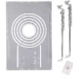
Downlight Installation Pan w/ Joist Arms 71176