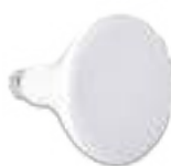
70437 | 70438